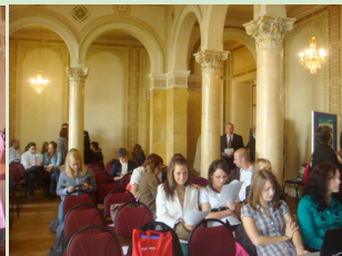
Vor der Preisverleihung Begegnung der Regionen