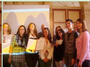
Gewinner Jugendpreis 2010 aus Emilia-Romagna