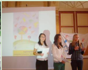
Botschafterinnen der Regionen bei der Preisverleihung