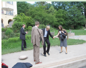
Freudenbergmuseum Wiesbaden Begegnung der Regionen

und der festlichen Preisverleihung in der Hessischen Staatskanzlei wider.