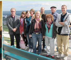
Rheintal Rüdeshheim Begegnung der Regionen