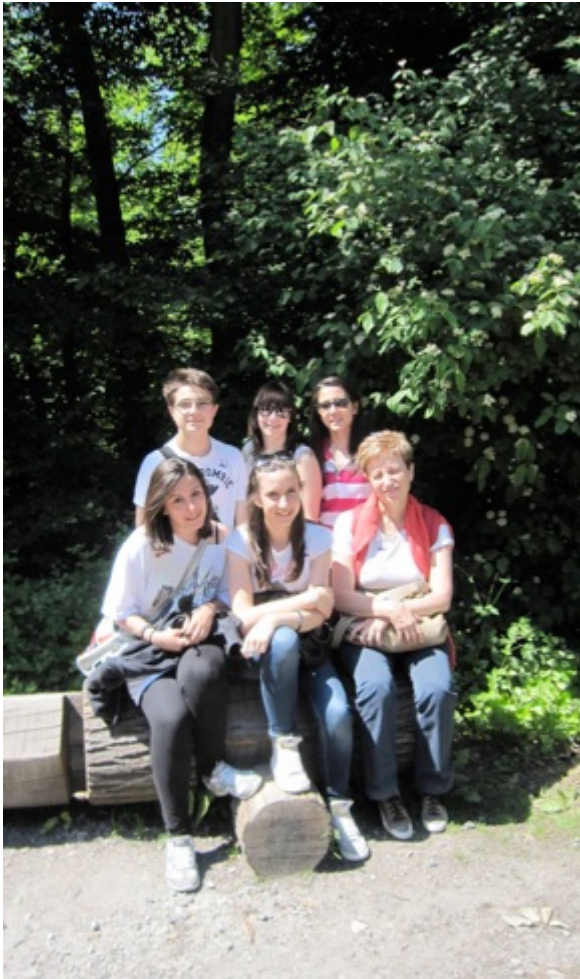
Classe 3° I, Liceo Ginnasio Statale G. Cevolani - Cento