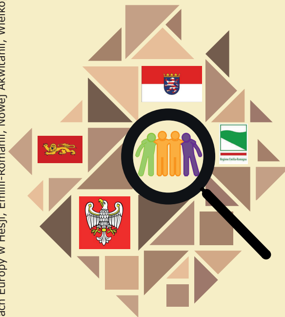
Illustration: Meike Bohland, Kunsthochschule Kassel

Konkurs w regionach Europy w Hesji, Emilii-Romanii, Nowej Akwitanii, Wielkopolsce