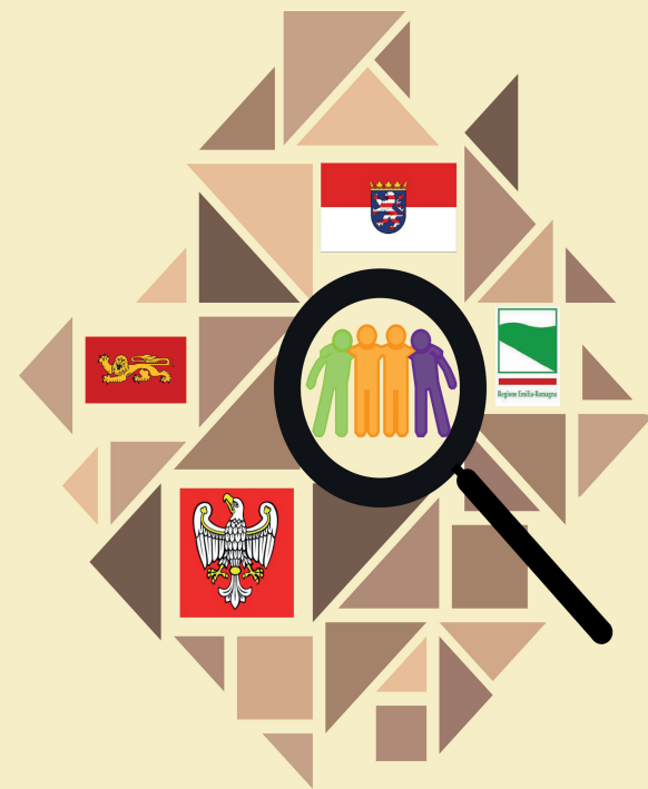
Illustration: Meike Bohland, Kunsthochschule Kassel